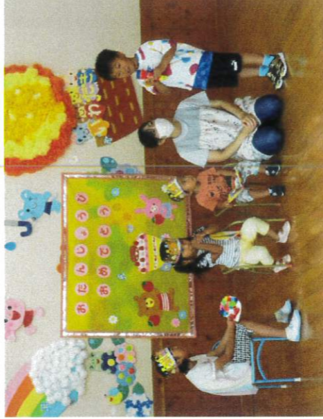
弟に質問中 「好きな車は何ですか？」 (ちょっと難しいかも…答えられるかな…?)