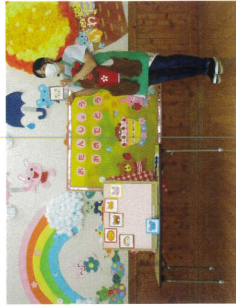
動物クイズ！ 先週出かけた親子遠足楽しかったね！ 動物公園にはどんな動物がいたかな？ 「これもいたね！」 「こ～んなにいたね！」