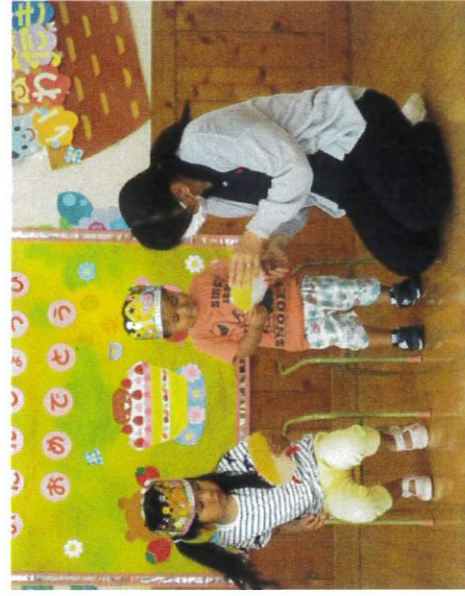
園長先生からのお祝いのメッセージとプレゼント、嬉しいな～