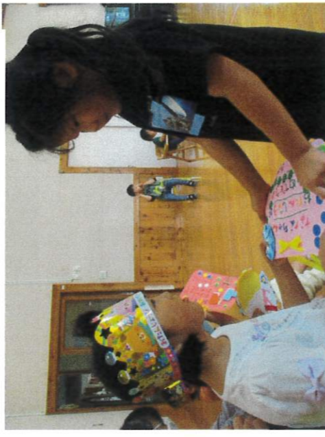
お兄ちゃんに代わりに答えても らおうかな…? 「ん？なにになに？」 「じいじのトラクター！」 すごい！言えたね！