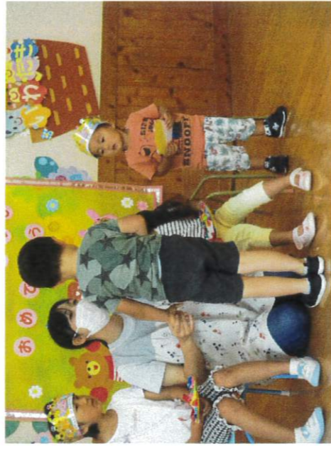
目の前まで行って質問中 「好きな食べ物は何ですか？」 「にんじんです(ハ▽ハ)」