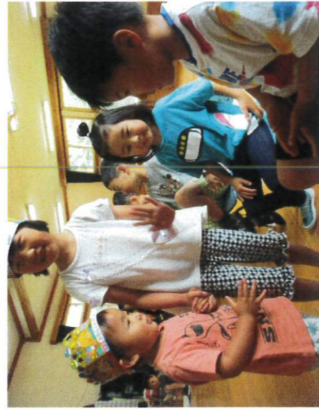
みんなとタッチしながら入場★