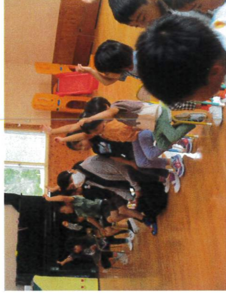
お誕生日のお友だちに色々聞きたい子どもたち。「はいはい！」アピールが止まりません。