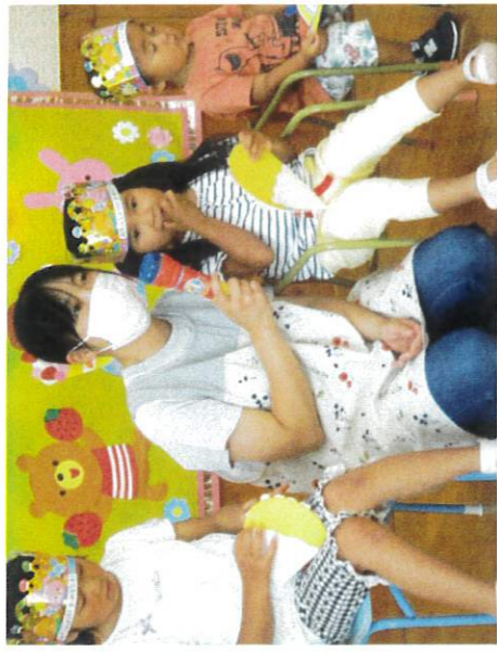
ドキドキしていたお友達も、みんなにお祝いでいらって笑顔が見えました！